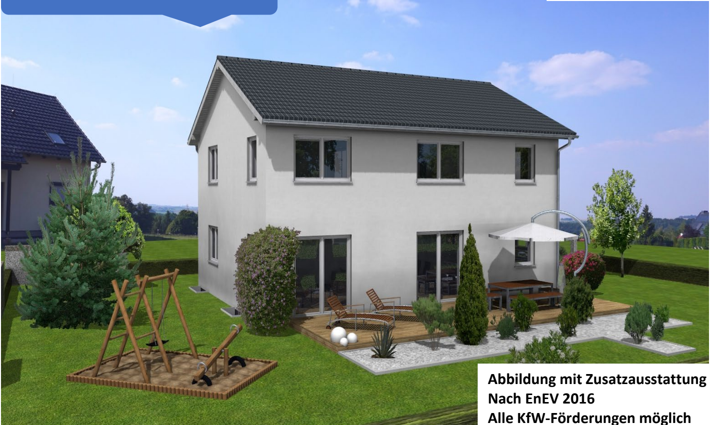
Abbildung mit Zusatzausstattung Nach EnEV 2016 Alle KfW-Förderungen möglich